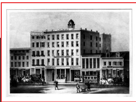
Abb. 1: Das Büro von Wiley am Broadway 161 in den 1840er Jahren. Damals hatte sich John Wiley kurze Zeit mit George Palmer Putnam zusam- mengetan und verlegte und verkaufte gemein- sam mit ihm Bücher und Zeitschriften.

So musste 1826 sein 18-jähriger Sohn, John Wiley, die Geschäfte übernehmen. An der Strategie sei- nes Vaters, zu verlegen und zu ver- kaufen, änderte er vorerst nichts. Auch ihm gelang es, große Namen für sein Unternehmen zu gewin- nen: So veröffentlichte beispiels- weise Herman Melville 1846 sei- nen Reisebericht „Typee“ bei Wiley – und schrieb Literaturgeschichte. Denn der Roman, der auch heute noch in der Forschung diskutiert wird, beschreibt sein Leben bei einem polynesischen Stamm und enthält starke Kolonisierungskritik – ein kühnes Unterfangen zur da- maligen Zeit. Wiley nahm den Roman deshalb auch erst an, als Melville einige Passagen weg- kürzte und besonders brisante Stellen somit herausnahm. Auch Edgar Allan Poes „The Raven“, das wohl bekannteste Werk des ameri- kanischen Poeten, verlegte Wiley und machte es damit einem brei- ten Publikum zugänglich. Den eu- ropäischen Literaturmarkt verlor