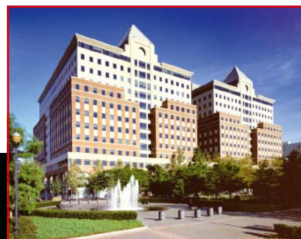
Abb. 4: Die Zentrale von John Wiley & Sons in Hoboken, New Jersey. Der Weltkonzern wird von diesem Gebäude aus gelenkt.